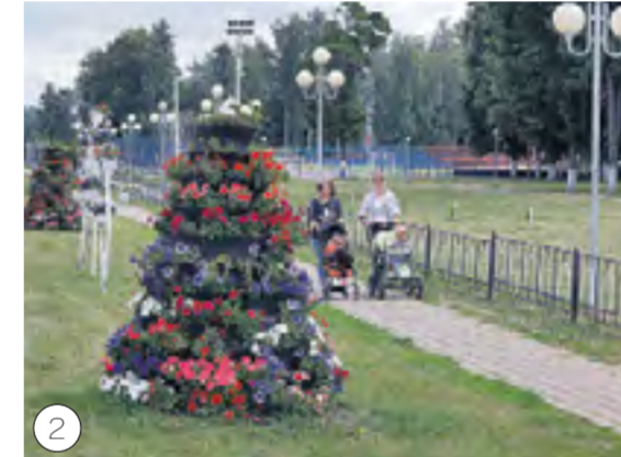
Советская улица в Прохоровке